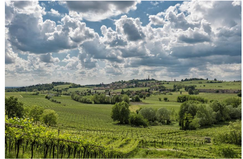
La région du Custozza, du Bardolino et du Lac de Garde...